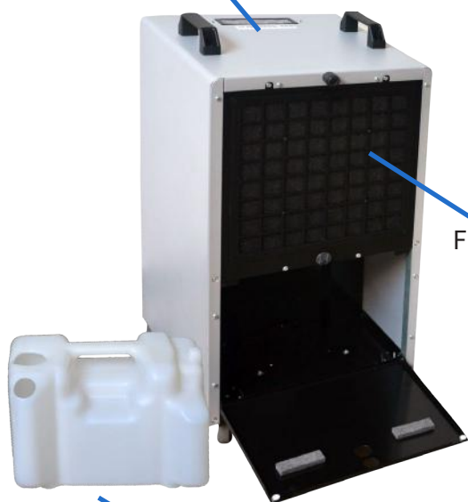
Tanica di raccolta condensa