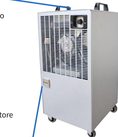
Filtro depolveratore aria