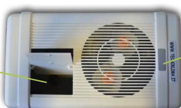
Tasto di accensione

Il produttore si riserva il diritto di apportare variazioni o modifiche migliorative ai propri prodotti senza preavviso. Le caratteristiche tecniche possono subire variazioni dipendentemente da modifiche apportate per eventuali personalizzazioni.