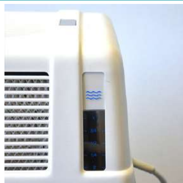
Livello visibile dell'acqua