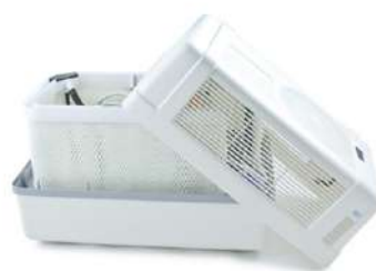
Umidificatore (parte interna)