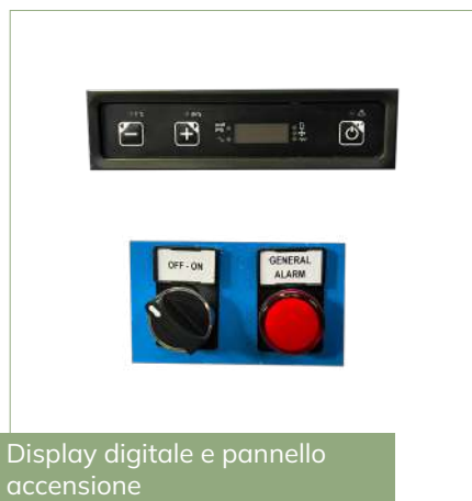
Display digitale e pannello accensione