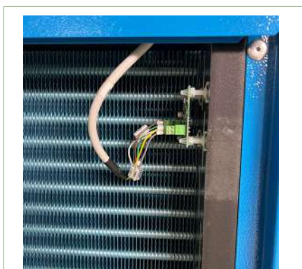
Scheda elettronica Temperatura/Umidità