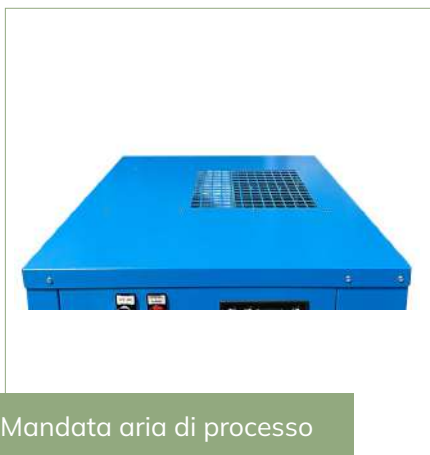
Mandata aria di processo