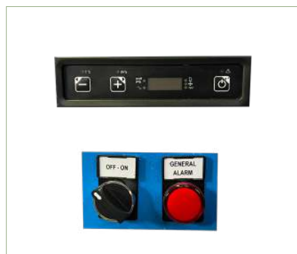
Display digitale e pannello accensione