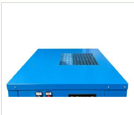
Mandata aria di processo