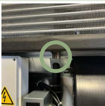
Attacco per lo scarico diretto della condensa