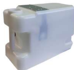
Tanica raccolta acqua