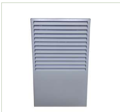
Pannello di controllo

I deumidificatori portatili sono apparecchi adatti al controllo dell'umidità. Dispongono di filtro antipolvere lavabile e di una vaschetta raccogli condensa. Le unità sono controllate da una scheda elettronica a microprocessore che gestisce tutte le funzioni dell'unità: il funzionamento generale, il sistema di sbrinamento automatico, allarmi e regolazione di umidità.