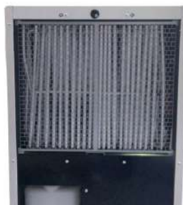
Griglia di protezione evaporatore