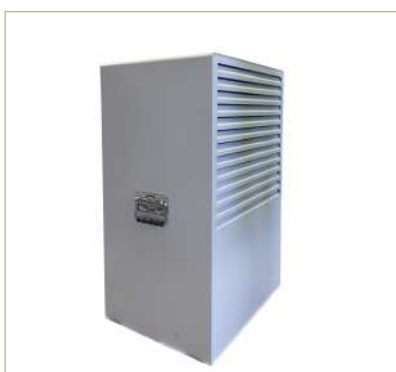
Filtro aspirazione acqua