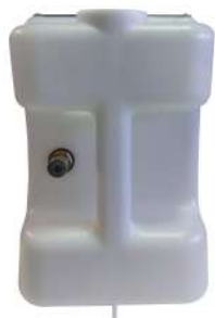
Scarico condensa diretto